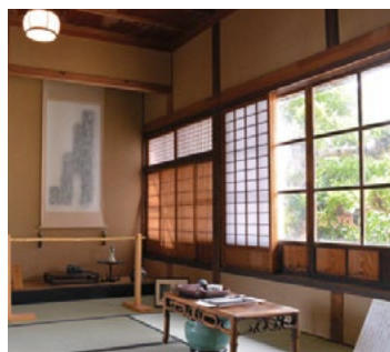
史迹 相马御风宅邸